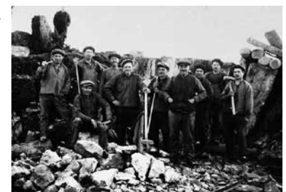
Stenarbetare i Aspvik, 1932.

Nu kan du titta på de cirka 2 000 bilder som finns i kommunens bildarkiv. Hjälp kommunen med detektivarbetet, känner du igen någon person eller plats så meddela gärna vem eller var bilden är tagen!