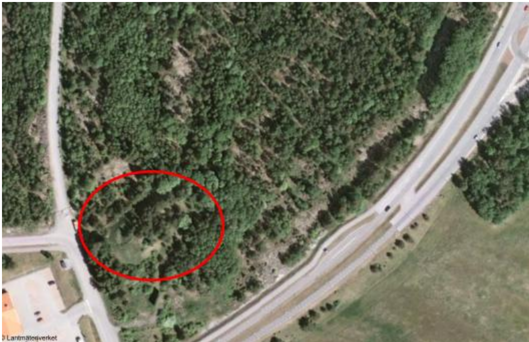
Figur 2. Flygfoto där aktuellt område är markerat