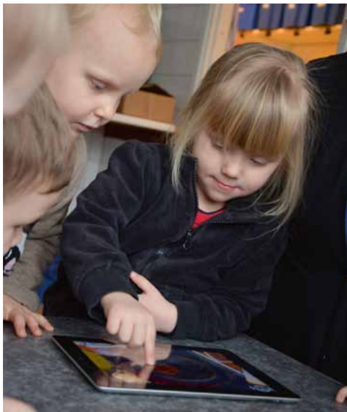
Lärplattorna engagerar barnen och är ett populärt verktyg i det pedagogiska arbetet. Här är det barn på Håbo-Tibble förskola som arbetar med lärplattan.