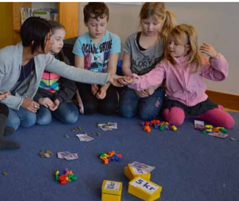
grå elever i årskurs ett på Lillsjöskolan.