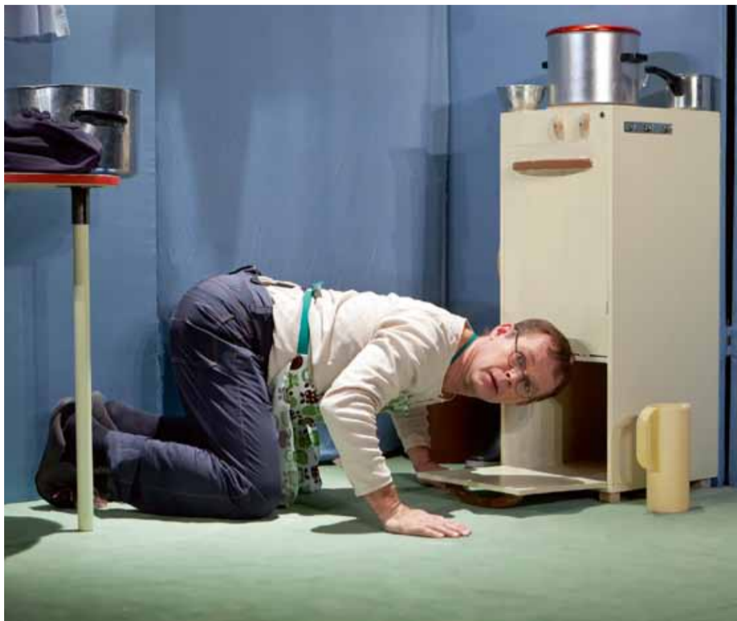
Teater Tre spelar Hemma hos på Kungsängens bibliotek lördagen den 20 april klockan 14.

Ladans Dag den 9 mars. Lustfylld dag när vi öppnar till prova-på-aktiviteter, visar upp det vi gör i Ladan och anordnar lite extra roligt för alla barn. Vintage- och Secondhandmarknad. Sön 24 mars. Antik & Samlarmarknad med Antikrunda sön 28 april (max 3 medtagna föremål/pers). Vårloppis sön 12 maj. KONSTigt i Ladan – sön 2 juni är det marknad med konstnärer i närområdet.