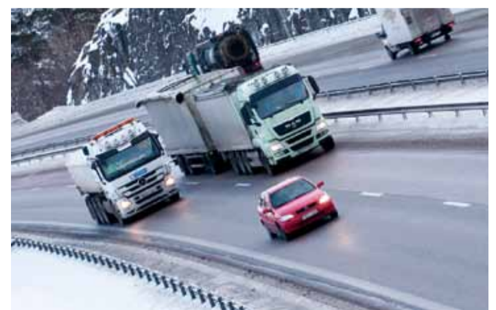
För att göra det enklare för trafikanter i Bro att nå E18 planerar Trafikverket för en ny trafikplats vid Kockbacka med anslutning till E18.

Läs mer om projektet på Trafikverkets webb, www.trafikverket.se/kockbacka